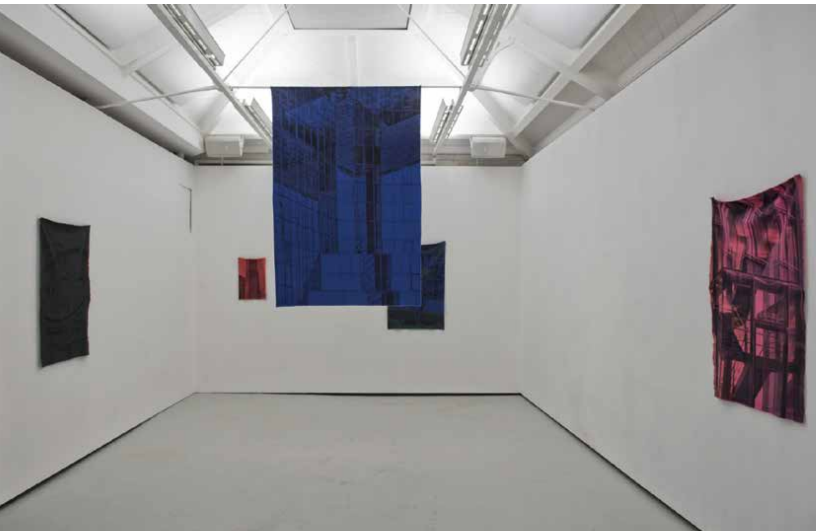
Paul Chapelier, Glass Walls (Vue d'exposition, Goldsmiths), 2016